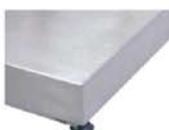
Plato en Acero Inoxidable