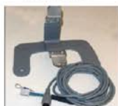
Kit para módulo remoto