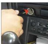
Adaptador para automóvil